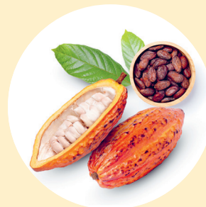
Kakao pākstis un pupiņas.