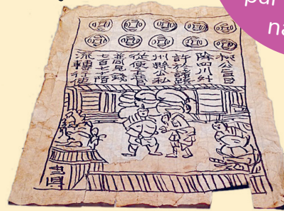
Pirmā papīra nauda.

Pirmo papīra naudu jeb banknotes sāka drukāt Ķīnā, kur to sauca par "lidojošo naudu".