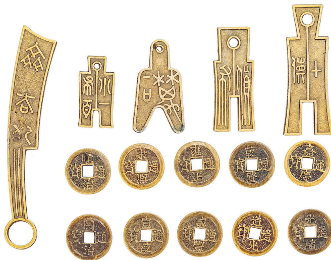
Senā ķīniešu nauda.

Kad cilvēki iemācījās iegūt un apstrādāt metālu, tas kļuva par visu iekārotu lietu, jo no metāla ļoti daudz ko varēja izgatavot un to bija grūti iegūt. Metālu bija vieglāk pārvietot nekā lopus, kažokādas vai gigantiskus akmeņus. Senajā Grieķijā un Ēģiptē par precēm norēķinājās pat ar 52 kilogramu smagām metāla plāksnēm, kas bija izkaltas vērsādas formā. Tās vērtību pielīdzināja vēršu baram. Vēlāk metālus – vispirms varu, vēlāk arī bronzu, dzelzi un sudrabu – maksājumos izmantoja stienišu formā.